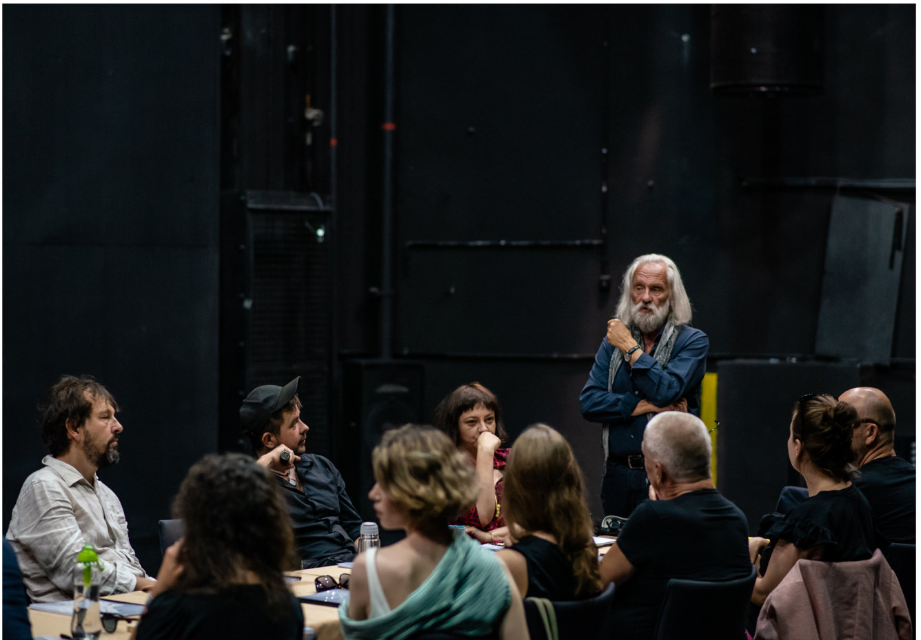
Próba do spektaklu „Antonówki” reż. Janusz Opryński

W najbliższym sezonie zaprezentujemy pięć premier, a pierwszą z nich będzie spektakl Janusza Opryńskiego „Antonówki”. Autor, zgodnie z duchem książki Sylwii Frołow („Antonówki. Kobiety i Czechow”, Wyd. Czarne), wydobywa historie czechowowskich kobiet, dając im współczesną energię i emancypacyjną świadomość. Spektakl zobaczyć będzie można na Dużej Scenie naszego teatru już w listopadzie.