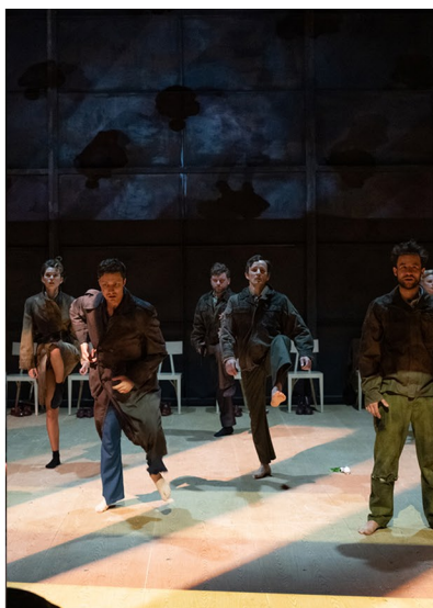
„Los Endemoniados/Biesy” reż. Marcin Wierchowski