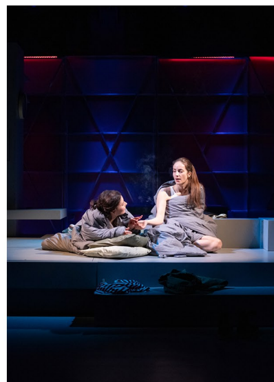
„Historia miłosna” reż. Wojciech Malajkat